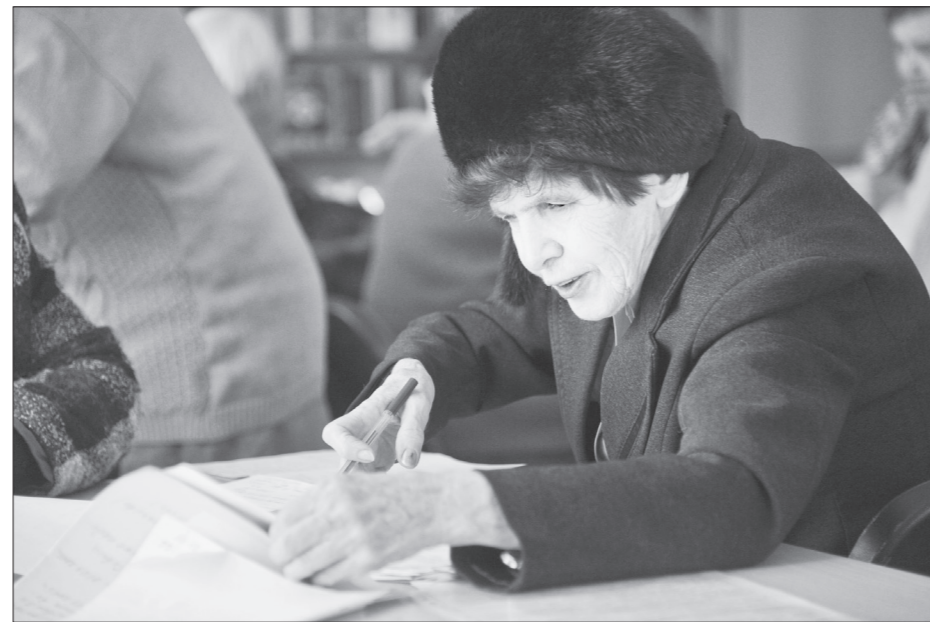
По заявлению пенсионера территориальный орган ПФР по новому месту жительства делает запрос пенсионного дела

ства или месту пребывания на территории РФ, то запрос оформляется на основании письменного заявления с указанием адреса фактического места проживания.