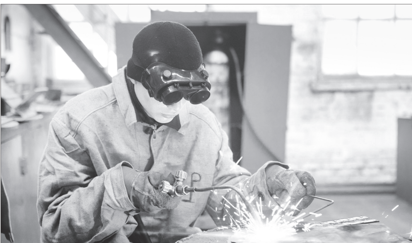
Сварщики без работы точно не останутся

Напоминаем вам, что по-прежнему ждем ваших писем. Нам важно не только ваше мнение о публикациях в "Сталинградской правде", но и советы, как сделать ее содержание интереснее. Не менее важны ваши письма о том, что вас волнует, - мысли о текущем моменте, рассказы о вашей жизни, о людях, которые могли бы стать молодому поколению примером служения Отечеству. И конечно же ждем ваших вопросов, на которые постараемся найти ответы специалистов. Пишите нам по адресу: 400131, г. Волгоград, ул. Ленина, 9, с пометкой - для "Сталинградской правды", или на e-mail: vp_red@vpravda.ru и id-vpravda@ya.ru .