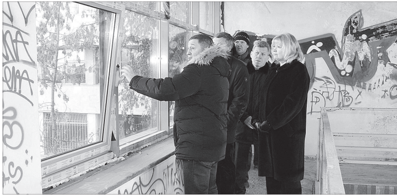
Реконструкция ГДЮЦа – на постоянном контроле губернатора Андрея Бочарова

Чтобы переломить ситуацию, понадобилась административная воля. После того как Андрей Бо-