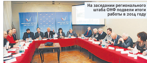
На заседании регионального штаба ОНФ подвели итоги работы в 2014 году