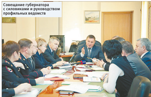
Совещание губернатора с силовиками и руководством профильных ведомств

Регион расширит систему видеонаблюдения на дорогах и в общественных местах