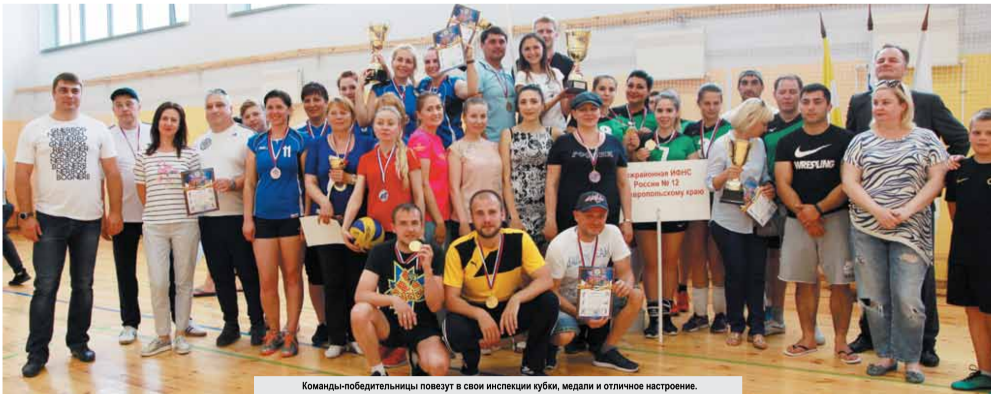
Команды-победительницы повезут в свои инспекции кубки, медали и отличное настроение.