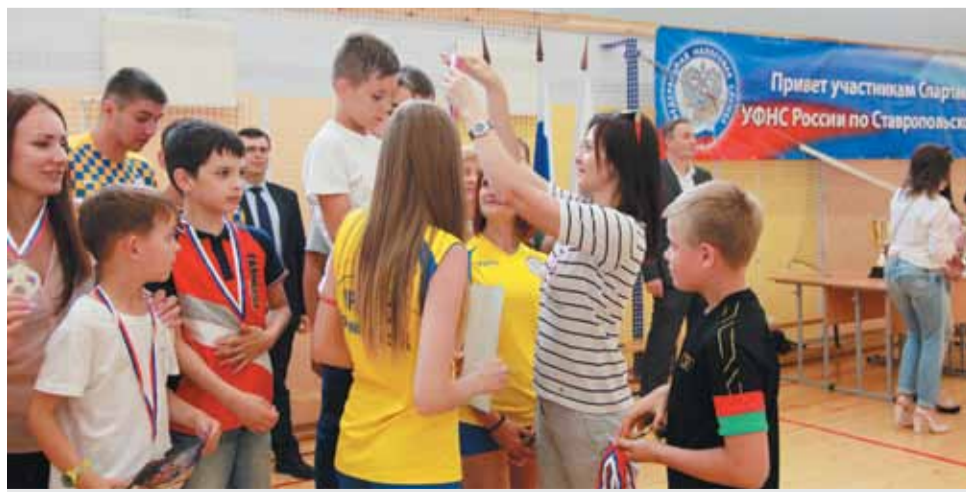
Для маленьких участников спортивные награды особенно дороги.

Завершилась IX Спартакиада УФНС России по Ставропольскому краю. Финальные соревнования прошли 15 июня в г. Ставрополе. Участвовали 13 команд из налоговых инспекций края и команда управления.