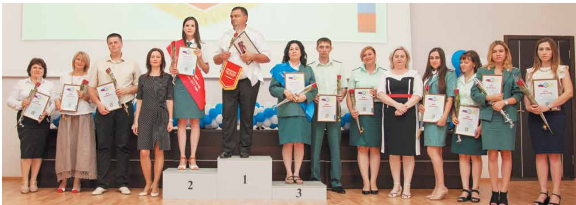
На пьедестале почета инспекторы, достигшие самых высоких показателей в работе.

В Ставрополе 29 июня состоялась церемония награждения победителя и дипломантов ежегодного конкурса «Лучший налоговый инспектор Ставропольского края». Традиционно мероприятие приурочено ко Дню рождения краевой налоговой службы: с 1 июля 1990 года она начала свою деятельность.