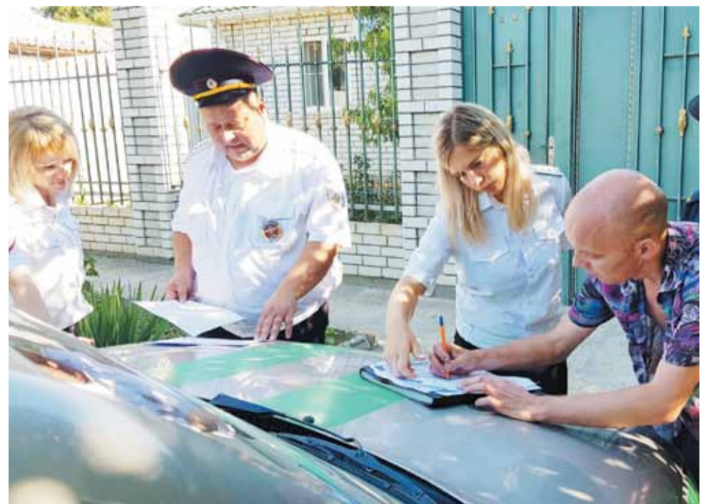
Арест автотранспортного средства.