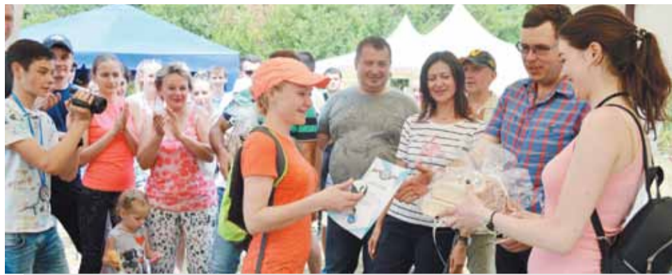
Налоговики в третий раз испытали себя на прочность на горе Бештау.