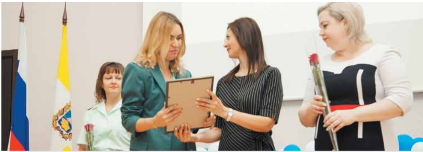
Конкурс - это возможность проявить свой профессиональный потенциал.