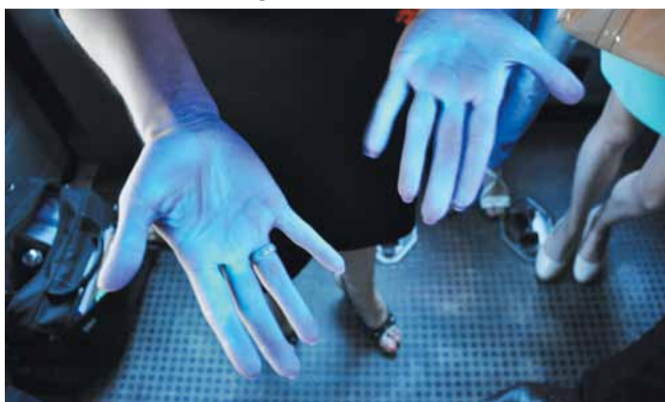
После передачи денег женщина была поймана с поличным.

По данным следствия, в мае 2015 года мужчина рассказал своей знакомой о намерении устроиться на работу в качестве судьи на территории Ставропольского края, которая сообщила, что у нее есть знакомая судья Ленинского районного суда города Ставрополя и она может поинтересоваться порядком сдачи документов для трудоустройства в судебные органы. В июле 2015 года женщина встретила со своей знакомой и судья сообщила ей ложные сведения о том, что у нее есть возможность оказать содействие в трудоустройстве мужчины на должность федерального судьи в городе Ставрополе в случае передачи ей денег в сумме