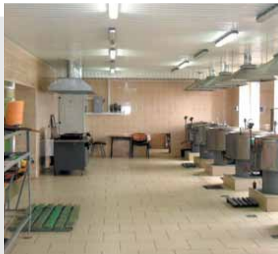
Исправительные учреждения претерпели значительные изменения за минувшее столетие, пройдя путь от ветхих помещений к современным коммунально-бытовым объектам.

В представлении многих россиян, совсем не связанных с УИС, образы ее учреждений, мягко говоря, устарели. Сырые, плохо освещенные каменные темницы безвозвратно канули в века, на смену им пришли светлые и теплые помещения с современной мебелью и техникой. Так, примером состояния мест лишения свободы XIX века является «Обзор деятельности Главного тюремного управления за 1879–1889 гг.», опубликованный в 1889 году.