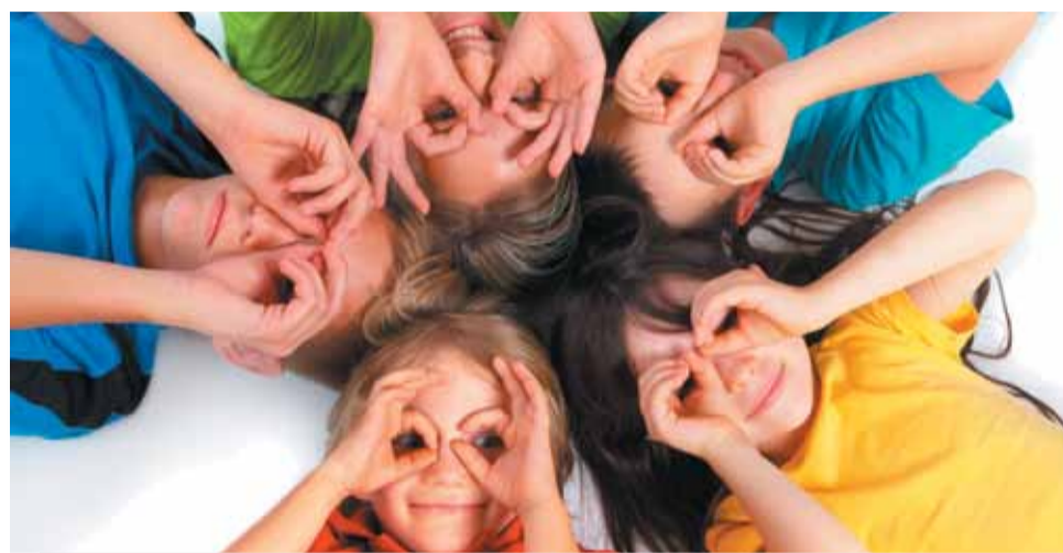
Что нужно знать о материнском капитале.

Сумма поступит продавцу не позднее, чем через 2 месяца после подачи заявления о распоряжении на оплату приобретаемого жилого помещения по договору купли-продажи в Управление ПФР. Заявление о распоряжении представляется с договором купли-продажи, прошедшим государственную регистрацию в Росреестре, и выписками из ЕГРП, подтверждающими право собственности. Если стороной договора купли-продажи являются не все члены семьи владельца сертификата, то необходимо оформить у нотариуса обязательство о том, что жилое помещение будет оформлено в общую собственность всех членов семьи. В строящемся доме по договору участия в долевом строительстве квартиру