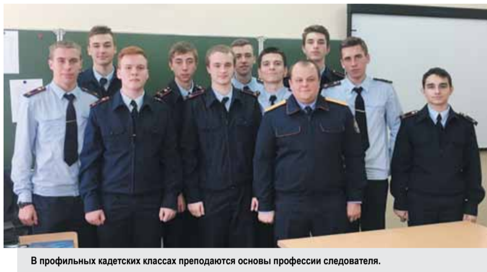
В профильных кадетских классах преподаются основы профессии следователя.

Очередное занятие цикла по теме «Судебное разбирательство. Особый порядок судебного разбирательства. Особенности производства в суде с участием присяжных заседателей» провел старший следователь отдела по расследованию особо важных дел следственного управления СКР по Ставрополь-