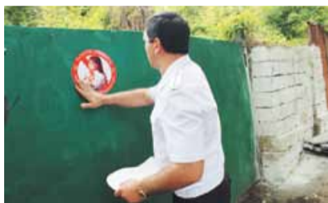
Судебные приставы спецотдела по алиментам расклеивают листовки на домах должников.

зовывают и нестандартные социальные акции. К креативности они прибегают не «славы ради». Просто должники нынче все больше ухищряются в желании избежать родительского долга: скрываются, переоформляют имущество на третьих лиц, а некоторые даже меняют фамилию.