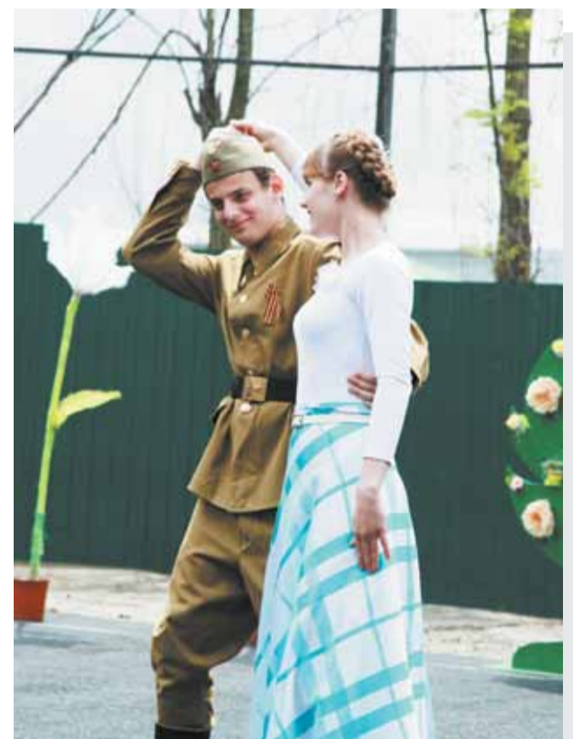
Танцевальные номера в исполнении юных актеров – неизменная изюминка каждого детского праздника.