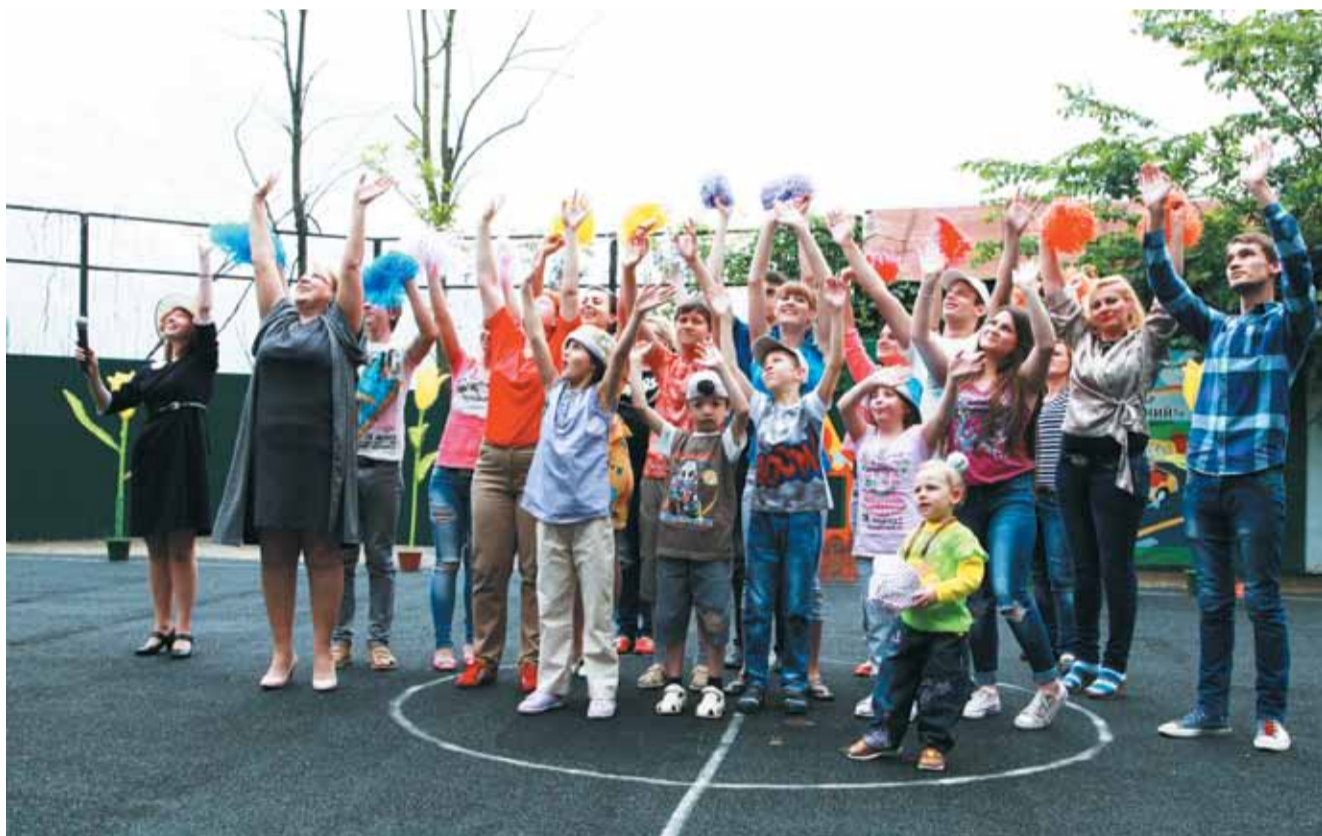
Детский спектакль завершился трогательной сценой.