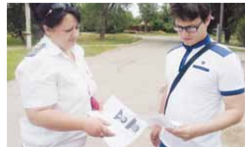
Судебные приставы Ипатовского РО проводят акцию «Помоги разыскать алиментщика».

структурных подразделений края посещают детишек в детских домах и приютах, устраивая для них концерты, спортивные праздники и чаепития. Также мы помогаем и устраиваем праздники для детей «злостных неплательщиков», с которых трудно взыскать алименты по ряду причин. Например, некоторые из них ведут асоциальный образ жизни или находятся в тюрьме, другие скрываются от работников службы или ничего за душой не имеют.