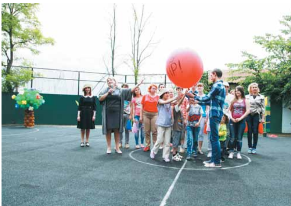
Дети и педагоги – равноценные участники театрализованных действий под открытым небом.

К мероприятию дети и воспитатели подготовились основательно. На импровизированной «сцене» под открытым небом «выросли» гигантские цветы и карликовые деревья из воздушных шаров. В ожидании гостей участники концерта репетировали свои роли, взволнованные малыши с нетерпением ждали начала действия, оглядывая «зрительный зал». И