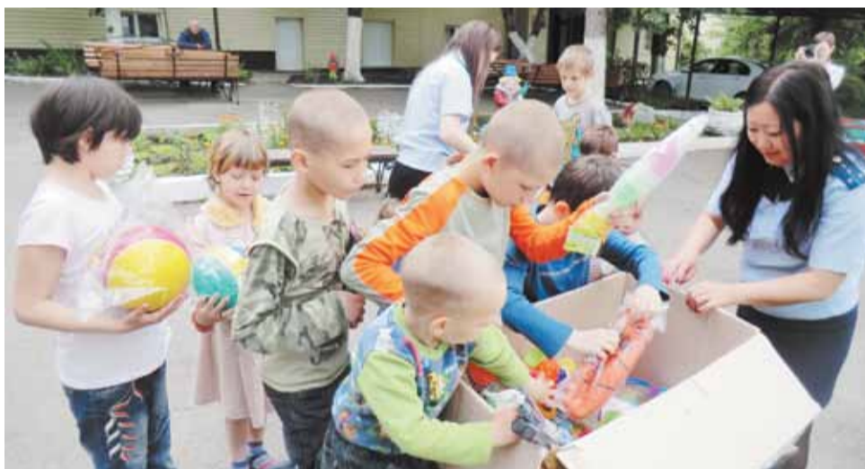
Пятигорские судебные приставы в ГОУ для детей-сирот и детей, оставшихся без попечения родителей «Детский дом (смешанный) № 32».