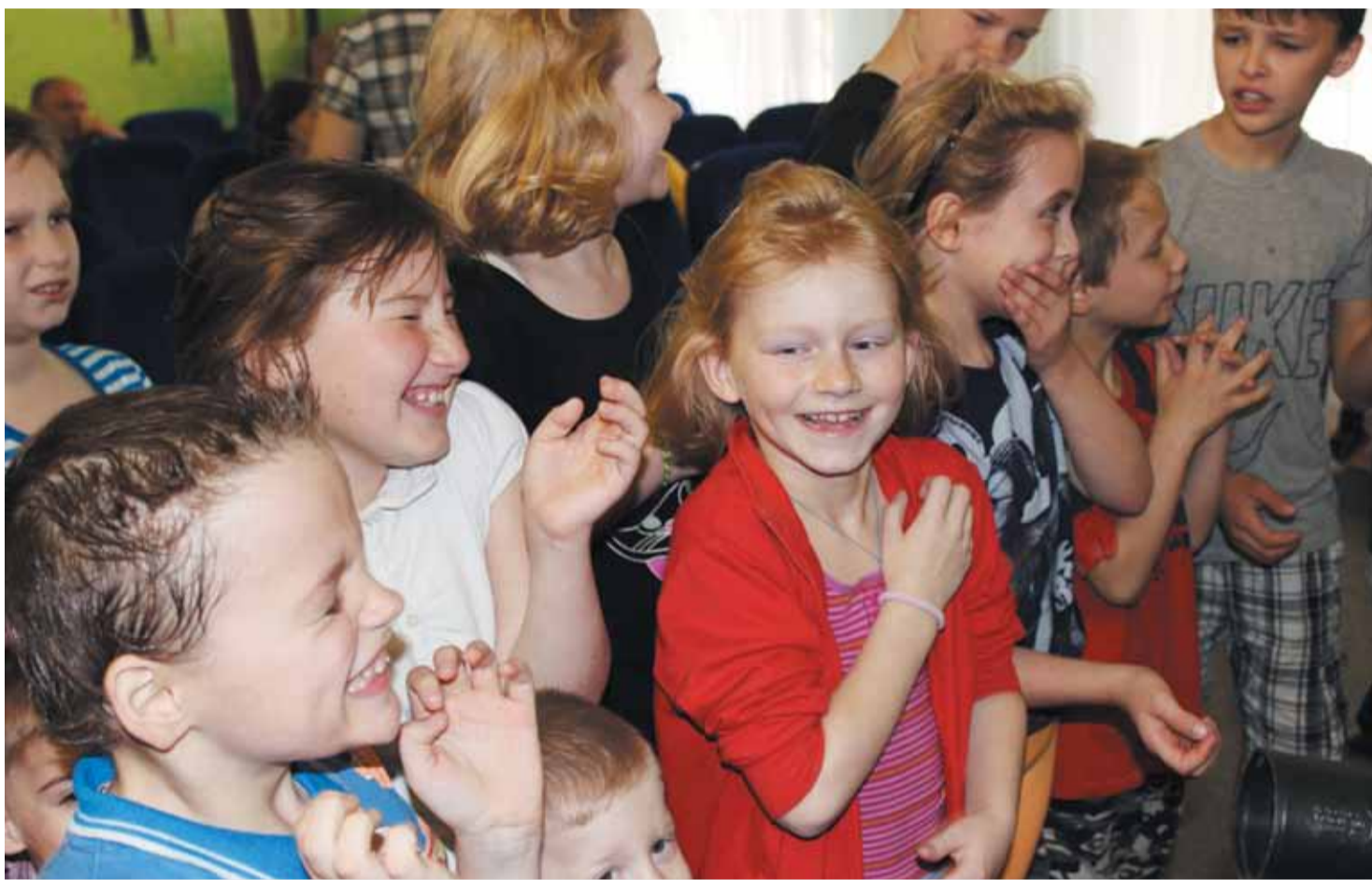
«Незабываемый день» для воспитанников ГКУСО «Ставропольский социальный приют для детей и подростков «Росинка».

Арест счетов и имущества, запрет в праве выезда за границу, ограничение в водительских правах – это лишь немногие полномочия работников службы, которые они используют ежедневно. Но нередко представители ведомства органи-