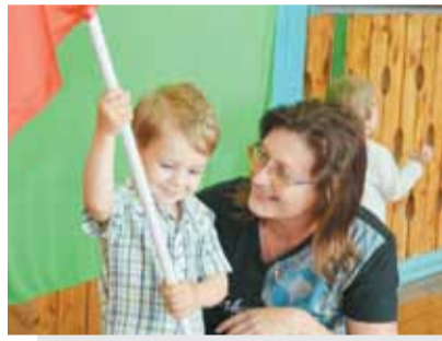
Знакомство с маминной работой.