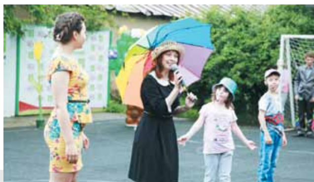
На импровизированной «сцене» под открытым небом «выросли» гигантские цветы и карликовые деревья из воздушных шаров.