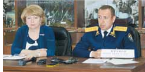
Уполномоченный по правам ребенка в Ставропольском крае Светлана АДАМЕНКО и и.о. руководителя следственного управления Следственного комитета Российской Федерации по Ставропольскому краю генерал-майор юстиции Игорь ИВАНОВ.