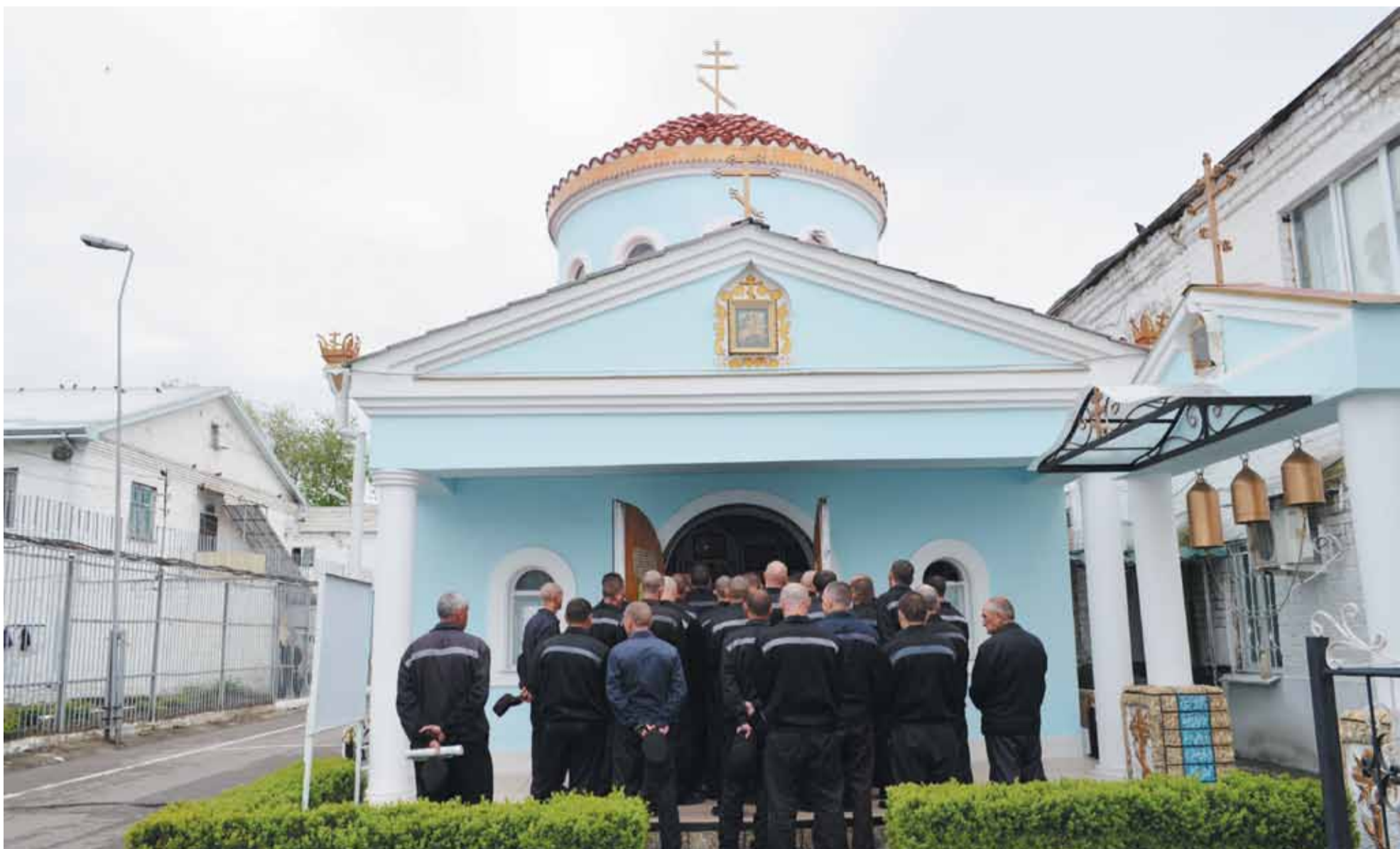
Храмы при колониях небольшие и поэтому не могли вместить в себя всех желающих прихожан, множество осужденных молились на улице.