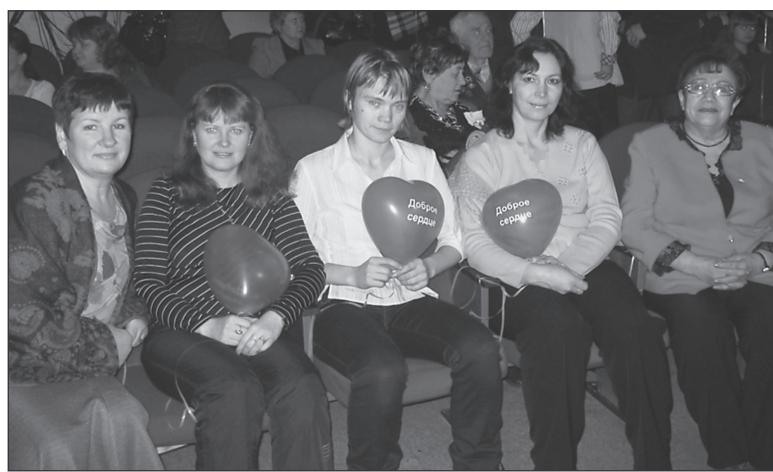
Сотрудницы УПФР Златоуста на благотворительном концерте в ДК «Булат»

В ходе концерта было собрано около 100 тысяч рублей. Это средства, вырученные от продажи билетов, и личные пожертвования горожан. Деньги направят златоустовским детям, находящимся на лечении в онкогематологическом отделении детской больницы.